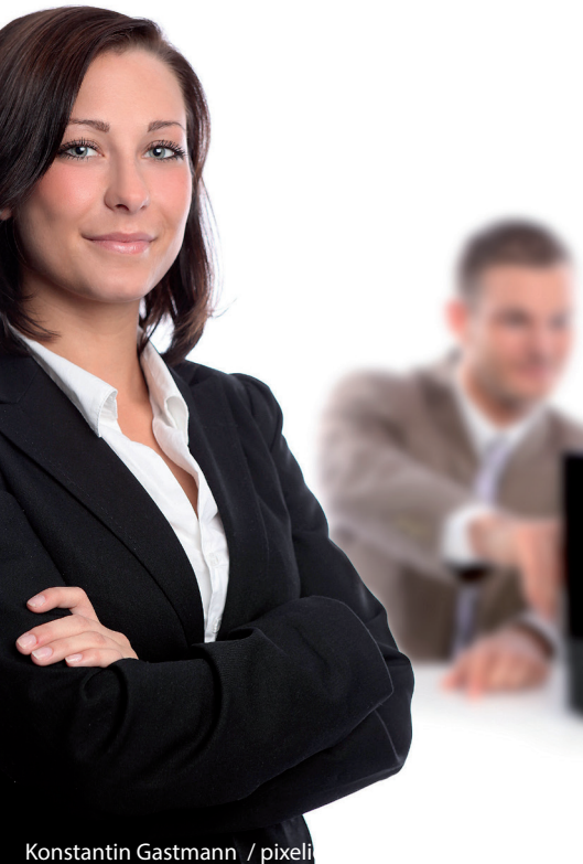
Konstantin Gastmann / pixel